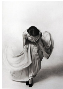
Louis Faurer “French Vogue, March 1973” © Louis Faurer