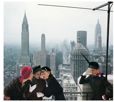
Norman Parkinson “Young Velvets, Young Prices, Hat Fashions III, 1949” © Iconic Images/The Norman Parkinson Archive