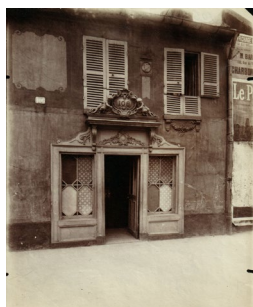
Eugène Atget At the Golden Shell, 42 rue de la Sourdiere, 1903 Albumen Print