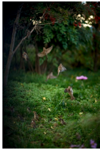
Terri Weifenbach “Des Oiseaux Series 01677, 2015”