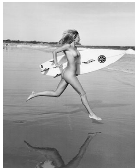
Michael Dweck “Sonya, Poles, Montauk, New York, 2002” © Michale Dweck