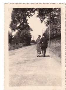
Vernacular Photograph (1930) フランス