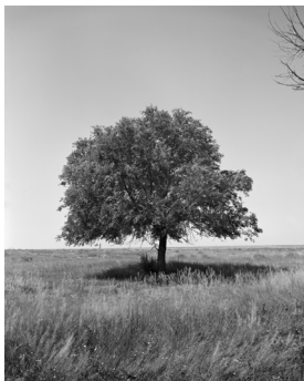
William Wylie “The Anatomy of Trees, Asiatic Elm #12-003, 2015” © William Wylie